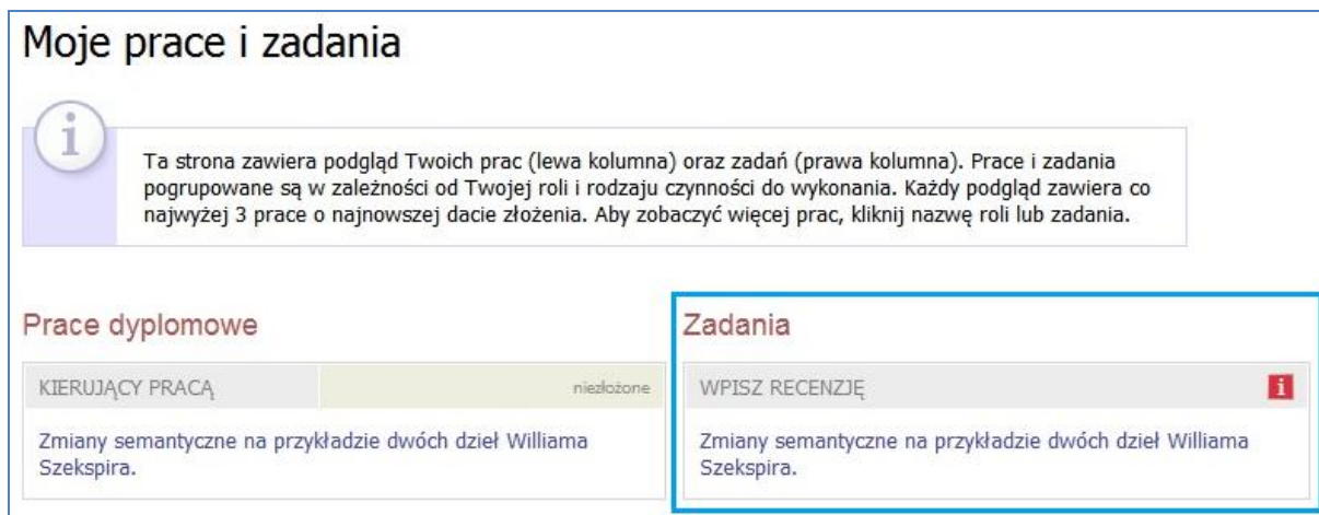
Rys. 5. Archiwum Prac Dyplomowych - zakładka MOJE PRACE

Po wyznaczeniu przez Dziekana Wydziału komisji egzaminu dyplomowego oraz wprowadzeniu przez dziekanat do systemu USOS danych recenzentów, na koncie opiekuna pracy pojawia się kolejne zadanie – wystawienie recenzji [Rys. 6].