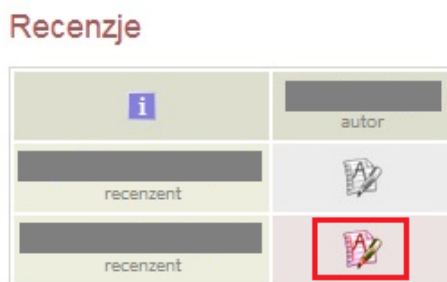
Rys. 6. Strona pracy dyplomowej - blok Recenzje

Przechodząc na stronę pracy dyplomowej, w jej dolnej części znajduje się blok Recenzje [Rys. 7], który zawiera odnośnik do formularza recenzji.