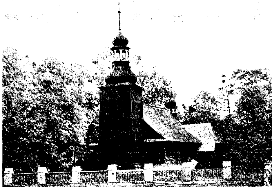
Widok kościoła Świętej Trójcy w Koszęcinie od południowego zachodu.