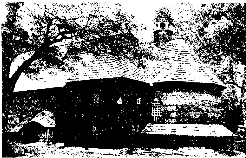
Widok od południowego wschodu na prezbiterium, zakrytą z chórem kolatorskim, schody chórowe oraz wejście od południa.