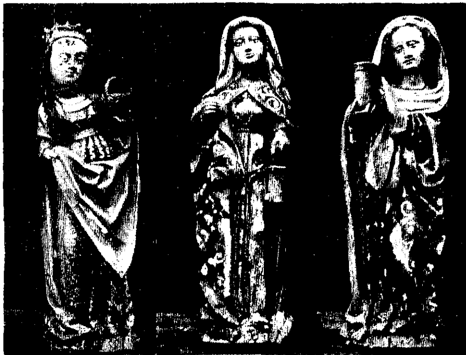
Zabytkowe figury św. św. Elżbiety, Doroty (?) i Magdaleny.